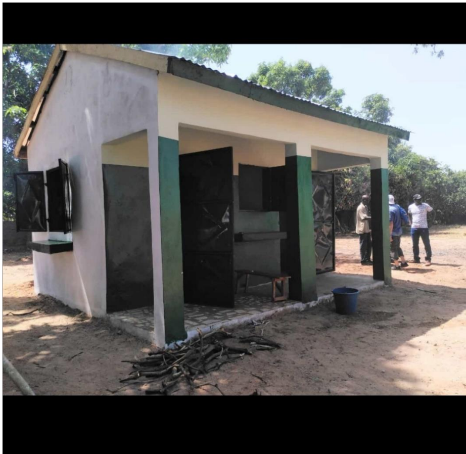
Foto: neue Schulküche an der Prince Lower Basic School

Das Baumaterial wird zum Großteil durch eine Spendenaktion des Partnervereins finanziert. Vor Ort arbeiten die Mitarbeiter beider Teams zusammen und sind direkt an den Bauarbeiten beteiligt. Wir freuen uns sehr, dass durch dieses Gemeinschaftsprojekt den ca. 350 Schulkindern an der Prince Lower Basic School nun wieder ein Mittagessen ermöglicht werden kann. Die feierliche Einweihung der Schulküche fand am 21.10.2021 statt. Der Verein hat eine Spendenaktion gestartet, mit der die Schulspeisung finanziell unterstützt werden soll, da das World Food Programme der UN in 2020 die bis dahin regelmäßige Förderung eingestellt hat.