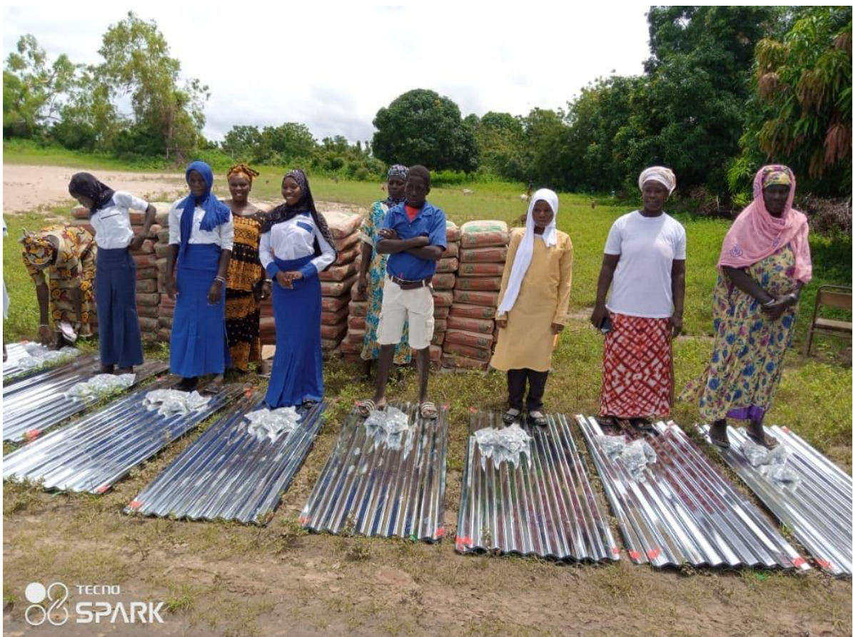
Übergabe von Baumaterial an Patenfamilien am 18.09.21