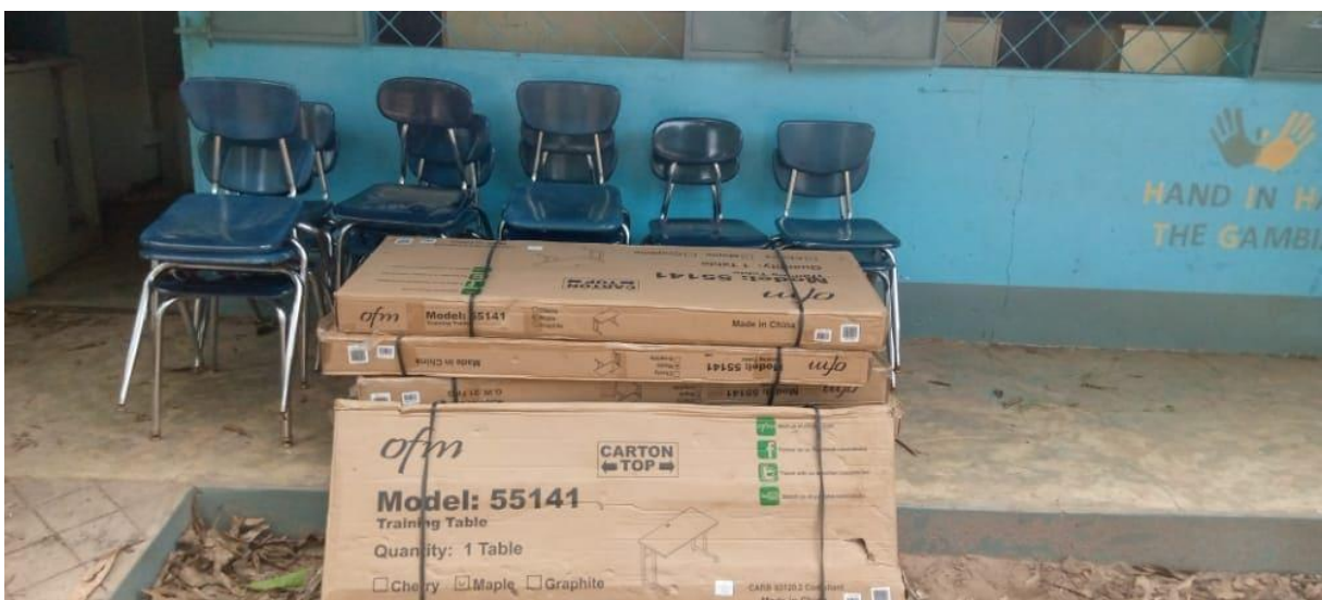
Foto: Übergabe der Tisch und Stühle an die Schule am 13.08.2021