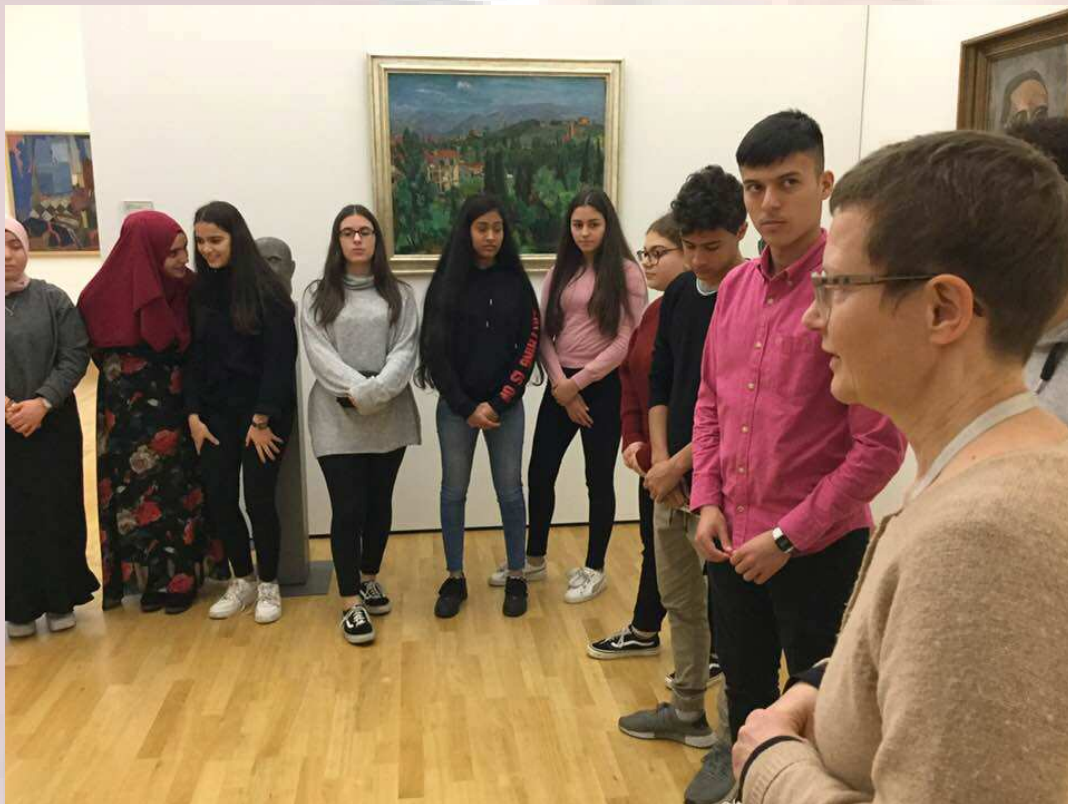
Fotos: Schüler/innen der Gambia-AG im Landtag Rheinland-Pfalz mit MdL Manfred Geis