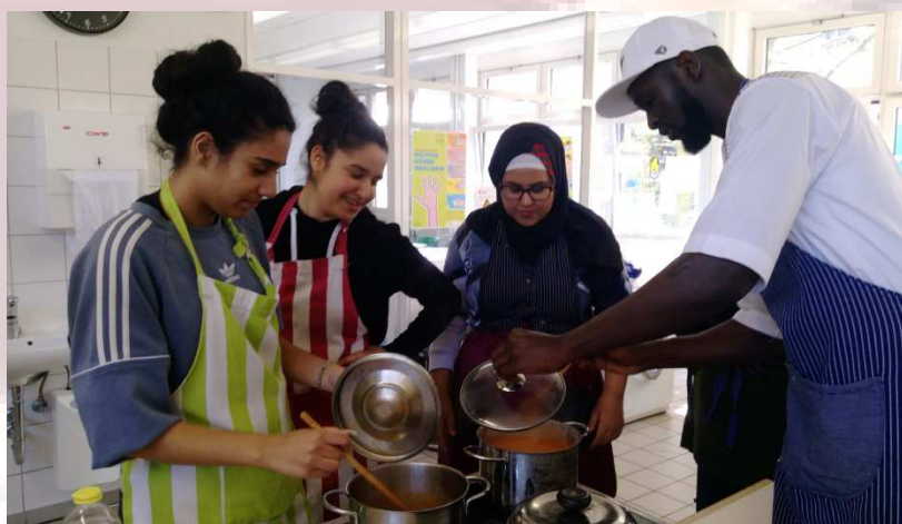
Fotos: Afrikanisch kochen in der Gambia-AG am 15.04.2019