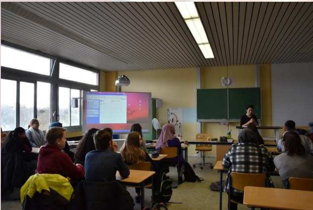
Foto: Schüler/innen der Gambia-AG am 11.03.2019

Den ausführlichen Bericht der Schule zum Termin am 11.03.19 können Sie hier nachlesen: http://www.kkr-mainz.de/11-03-2019-gambia-ag-klaert-auf-was-macht-deutsches-haehnchen-in-liberia/