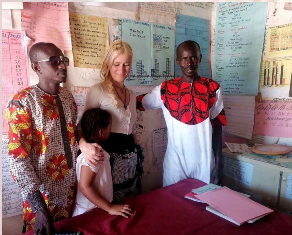
Fotos: Besuch der Prince Lower Basic School