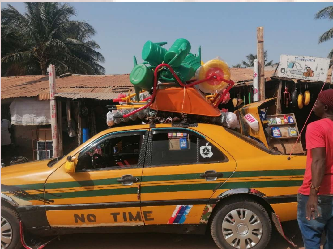
Fotos: Übergabe der Gartenmaterialien an der Ndungu Kebbeh upper and Lower Basic School, unten Kauf der Gartenmaterialien