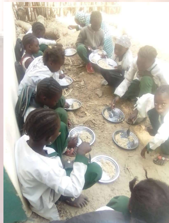
Fotos: Schulessen an der Ndungu Kebbeh Upper and Lower Basic School