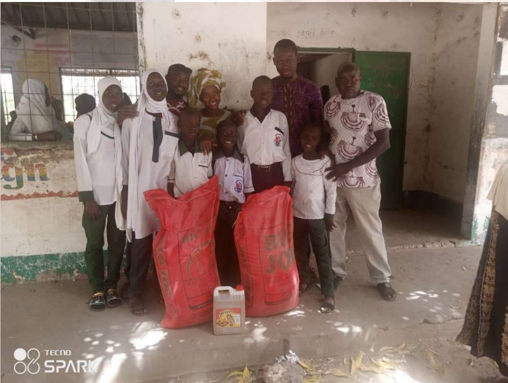
Fotos: Übergabe von Reis und Öl