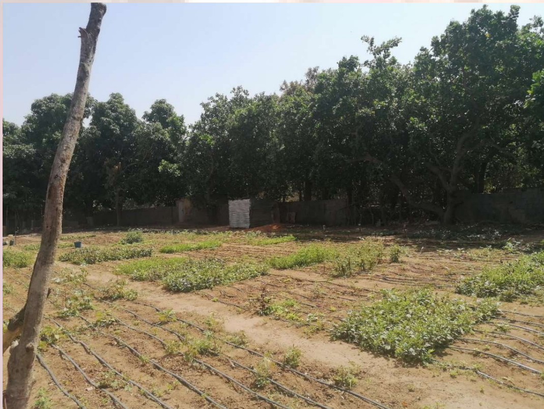
Fotos: Besuch der Schulgärten, hier: Prince Lower Basic School, im Gespräch mit dem Direktor