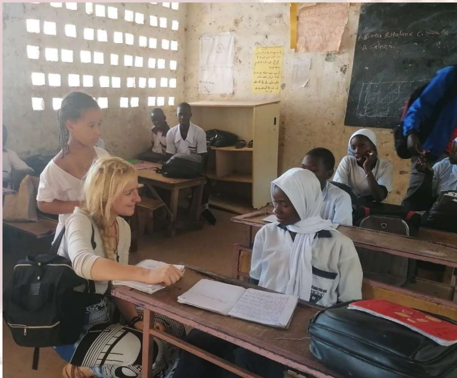
Foto: Besuch der Prince Lower Basic School

der Schulen zu besprechen und hierfür gemeinsam Prioritäten zu setzen. Die Schulleitungen haben sich beim Verein zudem sehr herzlich und umfanglich für die bisher geleistete Hilfe bedankt, sie sind sehr dankbar für die Zusammenarbeit. Die Schulen und Schulgärten wurden besichtigt, auch fand die Übergabe von Gartenmaterialien statt. Die verbesserte Ausstattung der Schulgärten soll zur Sicherung des Schulessens beitragen. Die Besuche haben die Situation der Schulen verdeutlicht und die Kontakte verstetigt und intensiviert. Der Empfang an den Schulen war außerordentlich herzlich und die Gespräche aufschlussreich. .