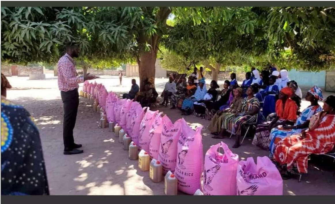
Foto: Lamin Bojang bei der Übergabe der Reissäcke an die Familien der Patenkinder im Januar 2022