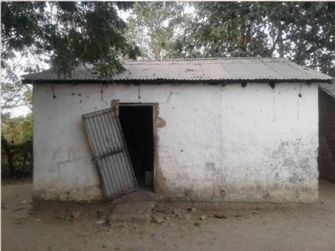
Fotos: Aktueller Zustand der Schulküche an der Ndungu Kebbeh Lower ans Upper Basic School von innen und außen