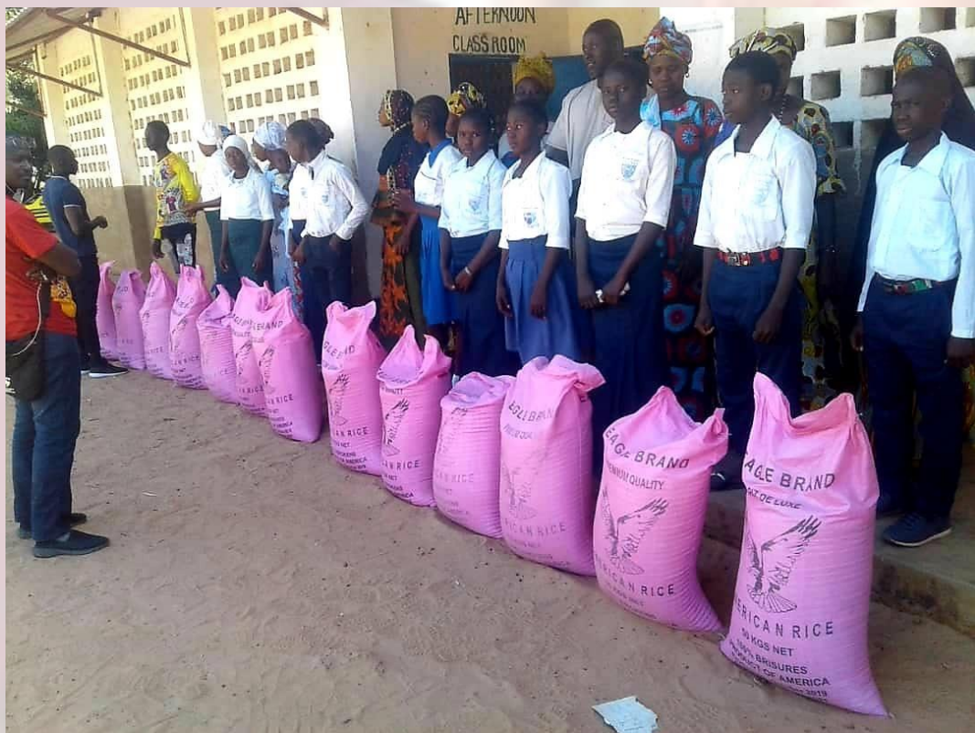
Fotos von der Übergabe der Reissäcke am 17.01.2020