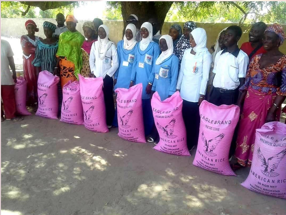
Fotos von der Übergabe der Reissäcke am 17.01.2020

Die Reisaktion fand zum vierten Mal statt. Wieder war sie dank der vielen großzügigen Spenden ein großer Erfolg. Ein herzlicher Dank geht deshalb an alle Spender!