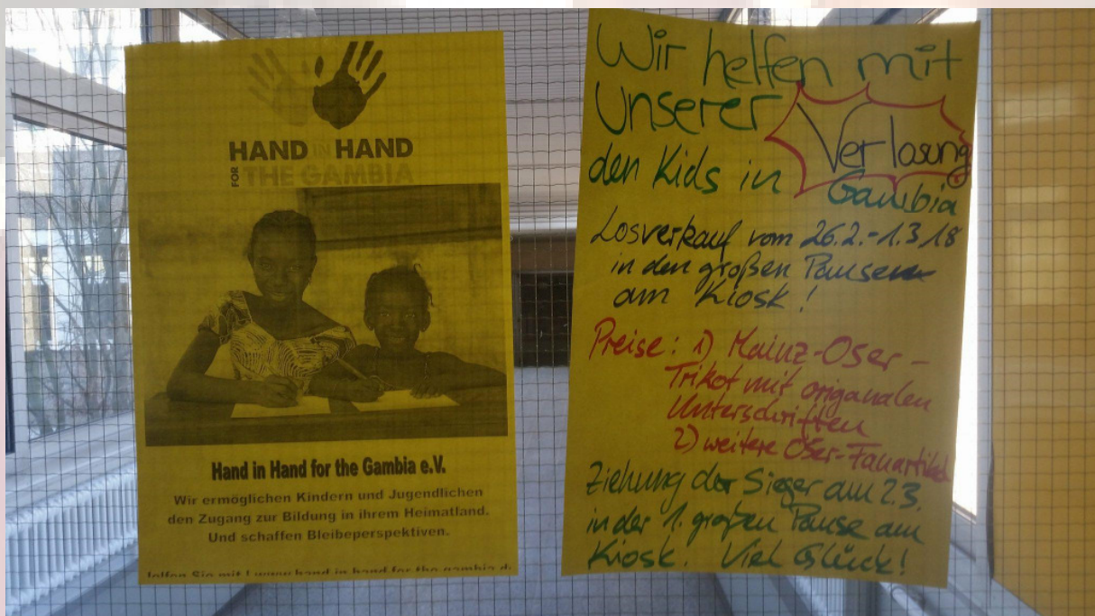
Foto: Schüler der Kanonikus-Kir-Realschule in Mainz haben im Schulgebäude dutzende Vereinsplakate aufgehängt, um für die Tombola zu werben.