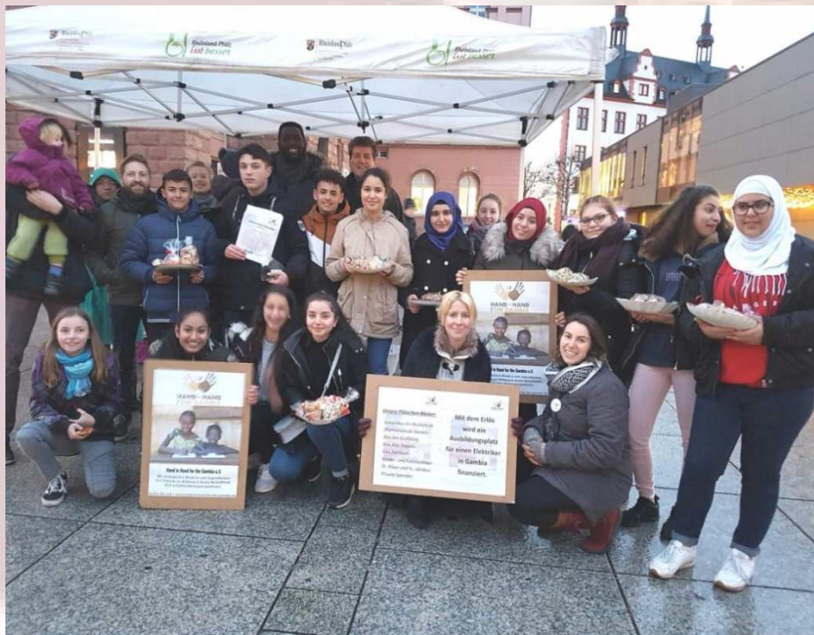
Foto: Plätzchen-Aktion 2017 vor dem Theater in Mainz