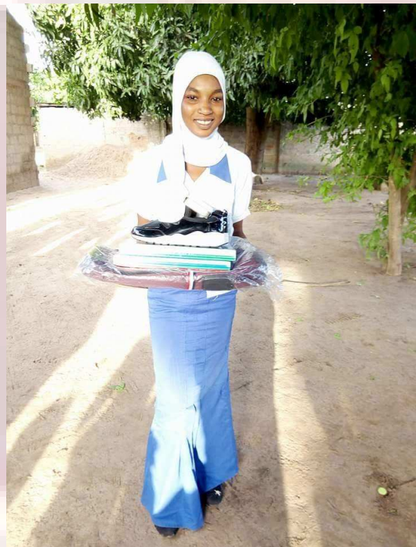
Fotos: Übergabe der Schulpakete an die ca. 50 Patenkinder am 14.09.2018